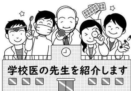
学校医の先生を紹介します